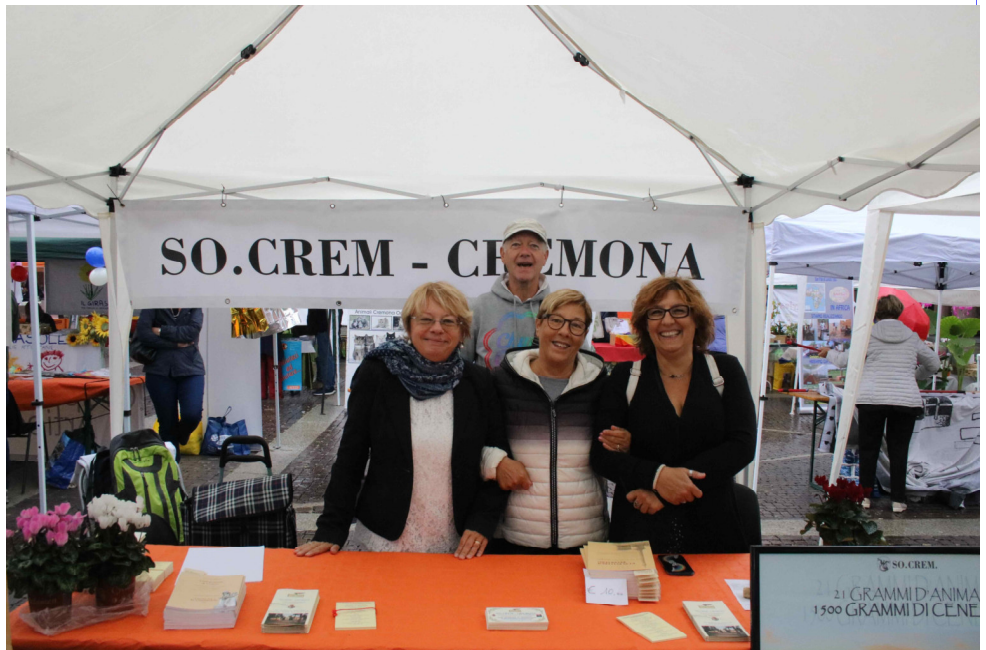
Festa del Volontariato 2019

A questo proposito ribadiamo la necessità di aiuti, per rendere il Servizio Associazione maggiormente fruibile per i vecchi e i nuovi Soci. La mole di lavoro si è intensificata per l'aggiornamento dati di tutte le dichiarazioni degli iscritti. Non ci stancheremo di ricordare che non è certa la nostra ricandidatura per un nuovo mandato (nel 2026). Attendiamo sempre persone desiderose di mettere a disposizione parte del loro tempo nel volontariato per SO.CREM.Cremona APS.